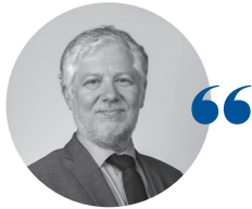
Luc DEREPA Président de la cour administrative d'appel de Bordeaux

Après une année 2020 marquée par la crise sanitaire et la baisse du nombre d'affaires enregistrées à la cour administrative d'appel de Bordeaux, le nombre d'affaires enregistrées a sensiblement progressé en 2021 (4 740 affaires, soit + 10 %). Se rapprochant de son niveau pré-crise sanitaire, l'activité reste principalement portée par le contentieux des étrangers (51,7 %), de la fonction publique (13,1 %) ainsi que celui de l'environnement, de l'urbanisme et de l'aménagement (10,8 %).