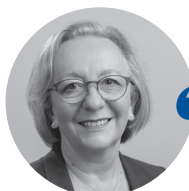
Brigitte PHÉMOLANT Présidente de la cour administrative d'appel de Bordeaux

Lors de cette année 2020 si particulière, la cour administrative d'appel de Bordeaux s'est réorganisée pour poursuivre son activité en dépit des contraintes sanitaires. Dans les jours qui ont suivi l'annonce du confinement en mars 2020, le télétravail a été généralisé tant pour les agents de greffe que pour les magistrats. Rendu possible en particulier par la dématérialisation des échanges entre les différentes parties au procès d'appel, via les applications Télérecours, et à une pratique bien installée de travail des magistrats sur dossiers dématérialisés, il a permis la poursuite de l'instruction des affaires et la